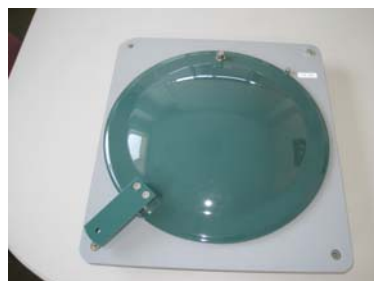
写真 B：製品背面（AH-300 型）